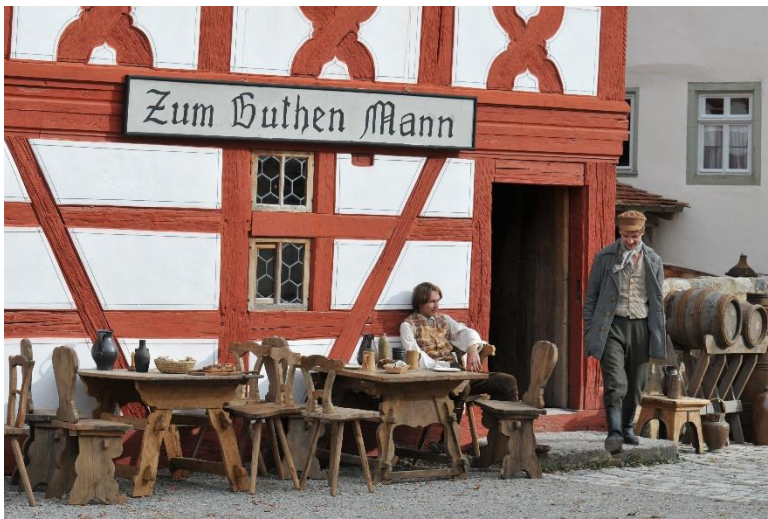
Bildunterschrift: Das Büttnerhaus aus Wipfeld im Fränkischen Freilandmuseum wurde im Märchenfilm „Der starke Hans“ zum Gasthaus umfunktioniert.